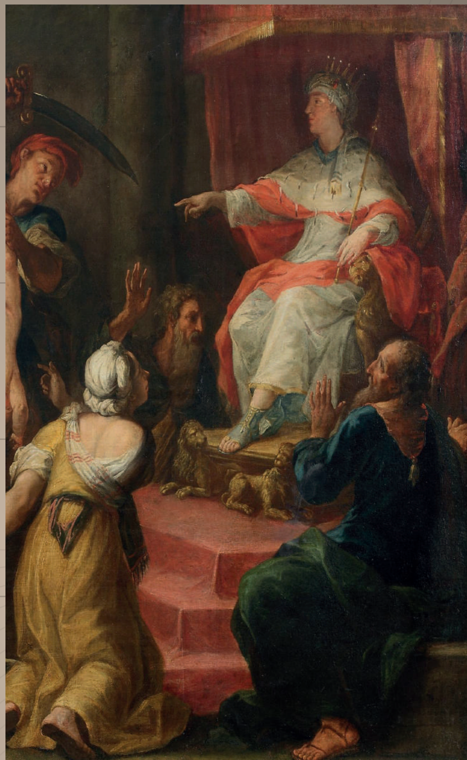
Картина «Суд Соломона», Ярославль, Россия

разрешение споров с налоговыми, таможенными и иными государственными регуляторами