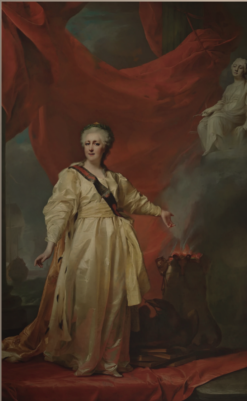
Картина «Екатерина II - законодательница в храме богини Правосудия», Санкт-Петербург, Россия

ПЛАНИРОВАНИЕ НАСЛЕДОВАНИЯ вопросы семейного права и sensitive matters