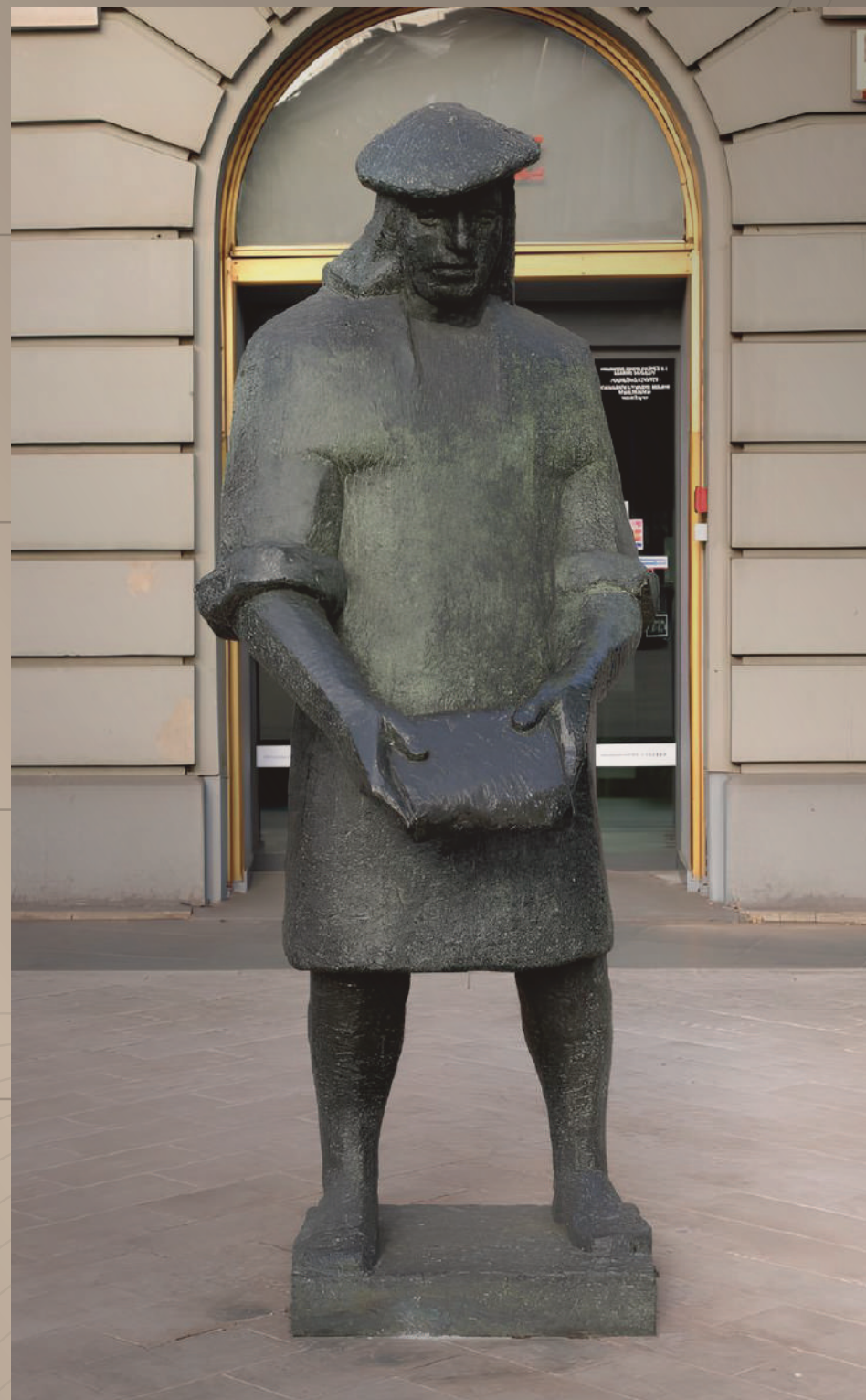
Статуя «Бенедетто Контрульи», Загреб, Хорватия