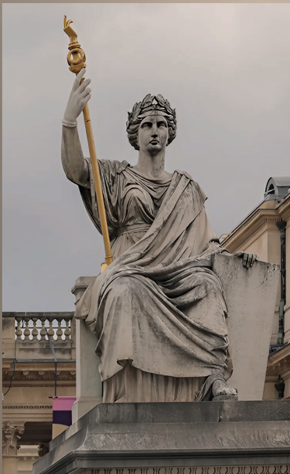
Статуя «Закон», Бурбонский дворец, Париж, Франция

расследование корпоративного мошенничества