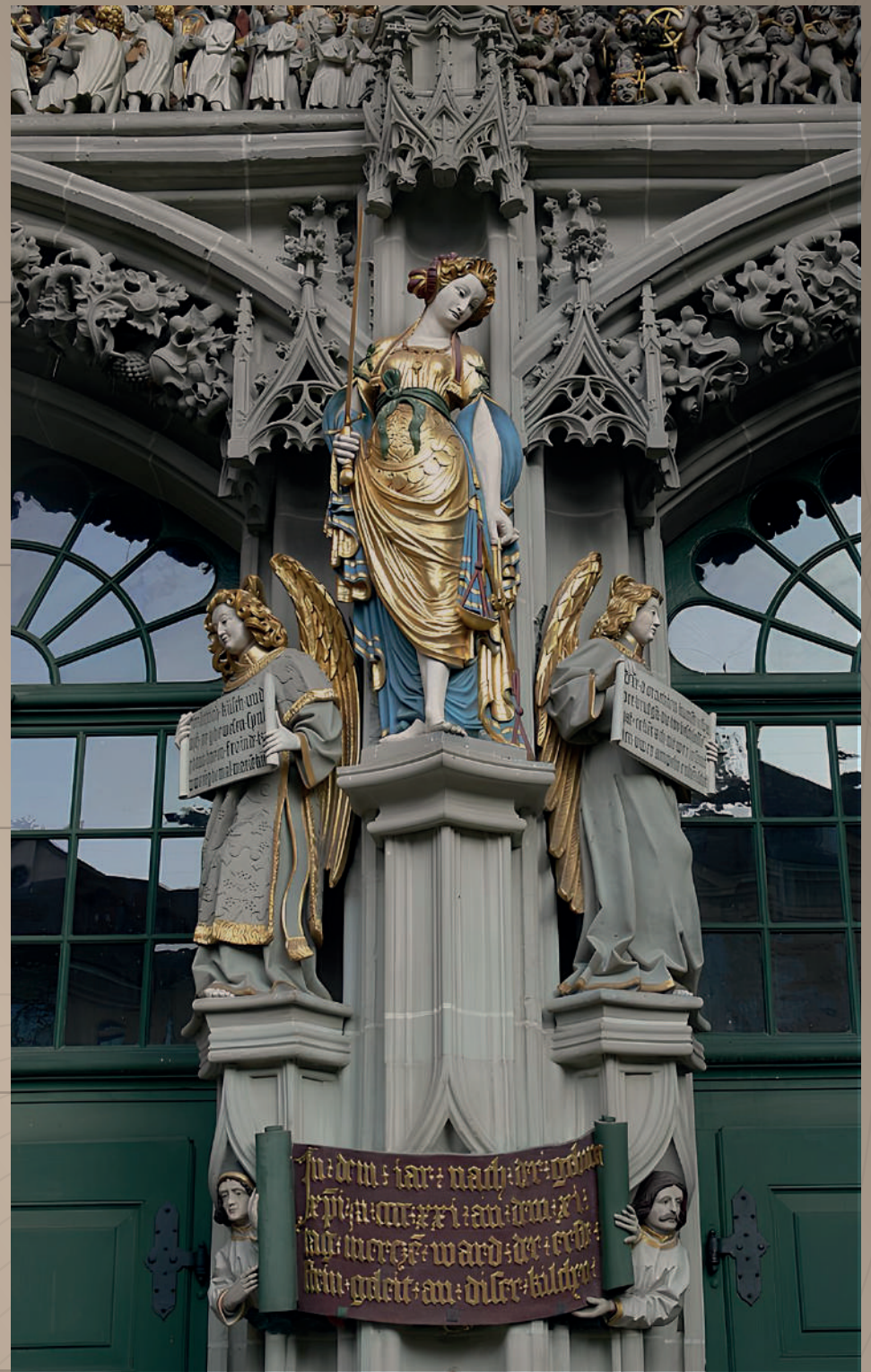
Скульптура «Справедливость», Берн, Швейцария

внешнего и внутреннего финансирования строительства