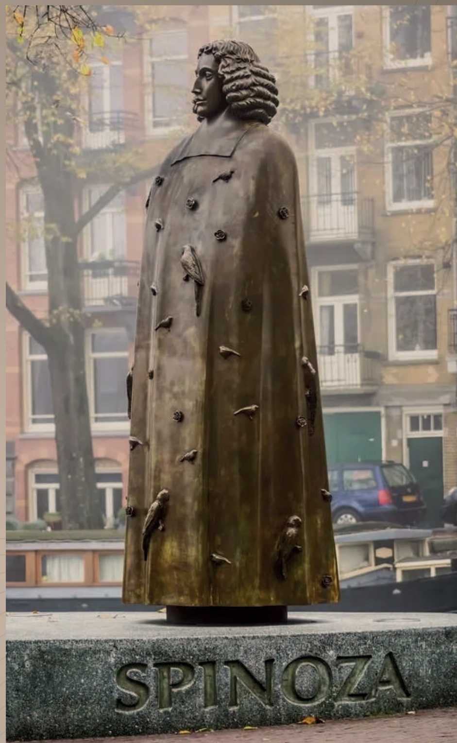
Статуя «Барух Спиноза», Амстердам, Нидерланды

Мы искренне верим в принципы холистического подхода и интегрируем это понимание в каждый аспект рабочего процесса, создавая для наших клиентов гармоничную и эффективную профессиональную среду, основанную на безусловных принципах добросовестности и взаимного доверия.